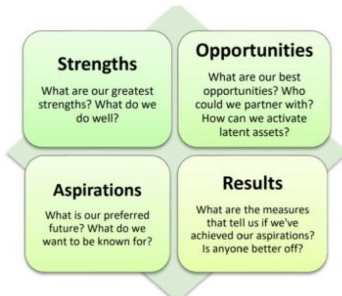
Figura 4: Analiza SOAR, Global Ecovillage Network

Analiza SOAR permite o gândire strategică comună cu diferitele părți interesate.