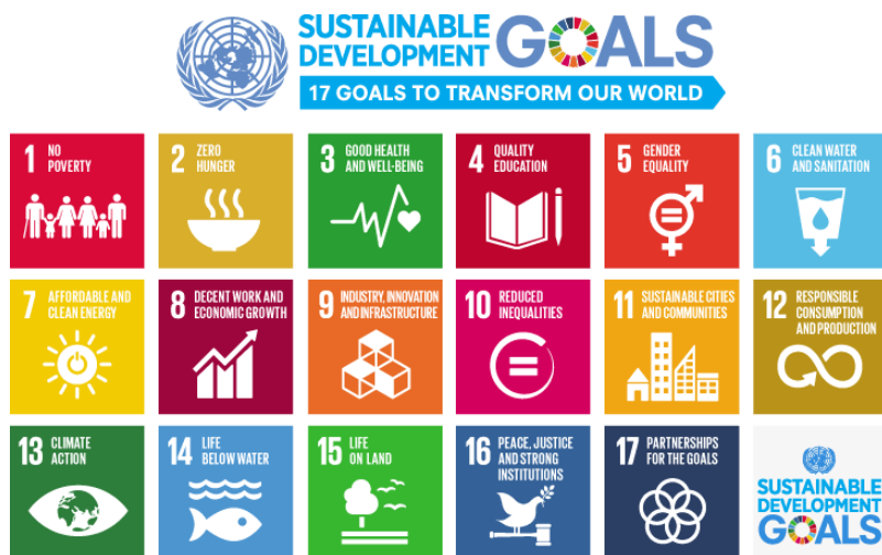
Figura 1: Obiectivele de Dezvoltare Durabilă (Națiunile Unite)

În 2016, Națiunile Unite au semnat cele 17 Obiective de Dezvoltare Durabilă (ODD-uri) ca un cadru global de dezvoltare viitoare, cu 169 de ținte specifice stabilite pentru aceste obiective: