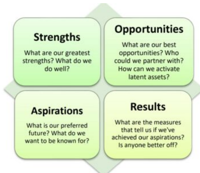
Abbildung 4: SOAR Matrix, Global Ecovillage Network

Ergebnisse: Woran können wir erkennen, dass wir unsere Bestrebungen erreicht haben? Ist jemand anders besser dran?